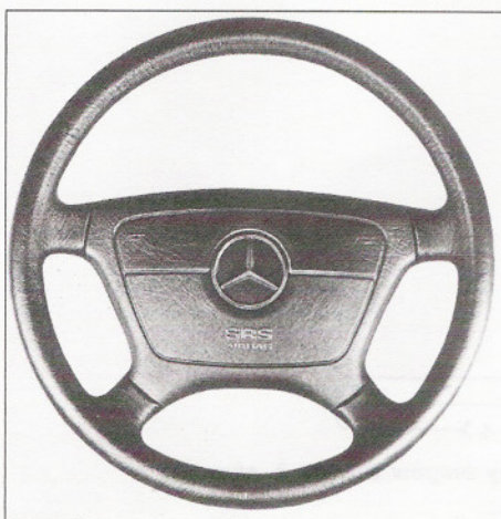
Rys. 16.2. Poduszka powietrzna w kole kierownicy samochodu Mercedes oznaczona skrótem SRS