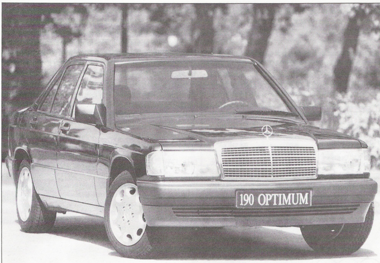
Rys. 16.1. Widok samochodu serii specjalnej 190 Optimum z widocznymi obręczami kół ze stopu lekkiego