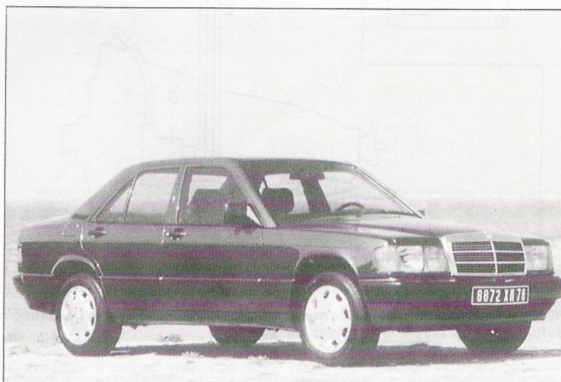
Rys. 16.3. Widok samochodu serii specjalnej 190 E 2,0 Azzuro