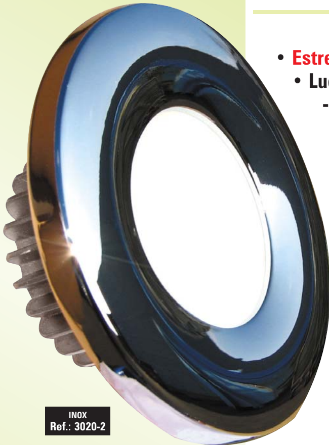
INOX Ref.: 3020-2