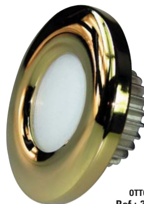
OTTONE Ref.: 3020-1

30W di illuminazione per soltanto 4W di consumo