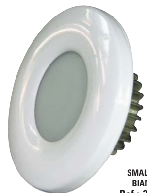
SMALTATO BIANCO Ref.: 3020-3